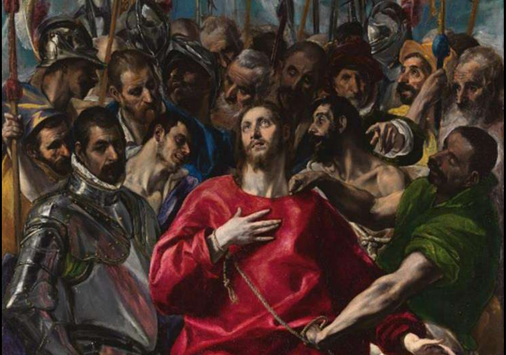
Décima estación: Jesús es despojado de sus vestiduras